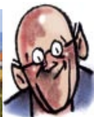
Un chauve-souris ...